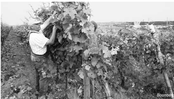
ドイツのワイン畑